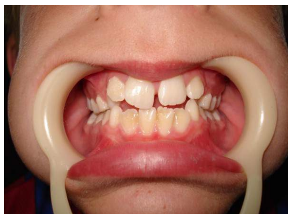
Abbildung 4: 3.7.2011 (Abb.Verzeichnis: 48)