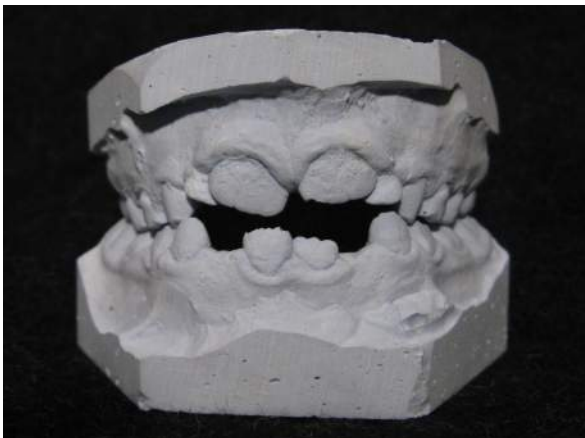
Abbildung 3: 25.5.2009 (Abb.Verzeichnis: 42)