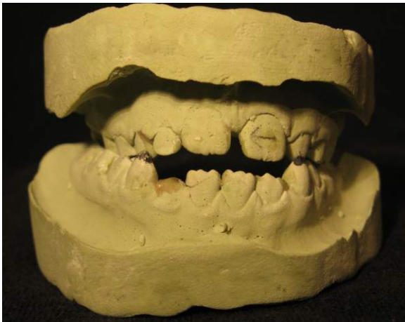
Abbildung 1: April 2007 (Abb.Verzeichnis: 35a)

Bei der Erstuntersuchung des Mädchens (22. 6. 2007) lautete der Befund: Gebisswechsel altersgemäß, Bisslage regelrecht, Kreuzbiss rechts, Kreuzverzahnung bei den Zähnen 73 und 83 (d.h. der rechte untere Dreier steht vor dem oberen rechten Dreier), die Weite im Unterkiefer gut, der Oberkiefer schmal, die Front leicht lückig, frontal offener Biss, Sigmatismus (Anhang. 9.2). Im Unterschied zur zahnärztlichen Diagnose wird im klinischen Befund aufgrund des Gipsabdruckes ein Distalbiss konstatiert (Anhang 9.3).