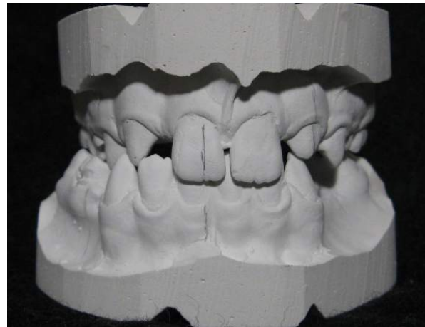
Abbildung 2: 17.6.2010 (Abb.Verzeichnis:41a)

Da bei den Zahnfehlstellungen in der harten Knochensubstanz Änderungen durch das geduldige Üben des Kindes erreicht werden sollen, muss von vornherein mit einem längerem Prozess gerechnet werden. So war schon im Vorfeld klar, dass mehreren Epochen erforderlich sein würden, um folgende Problematiken längerfristig zu bearbeiten: